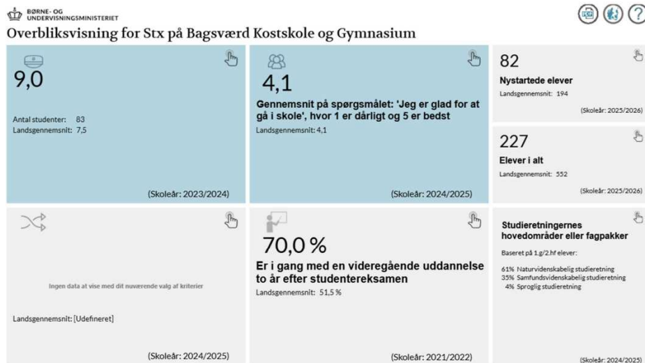
Figur 1: Resultater BK Gymnasium. Kilde uddannelsesstatistik.dk.